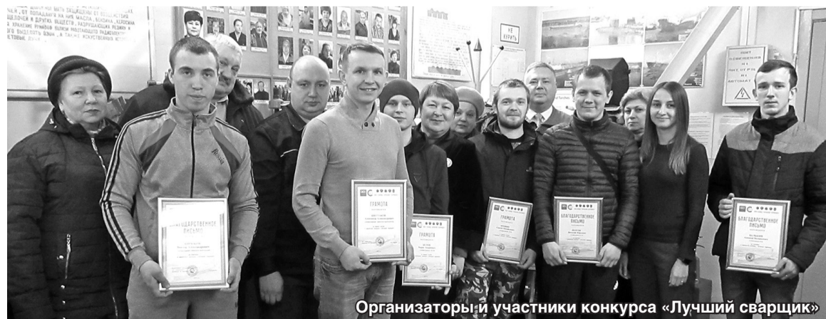
Организаторы и участники конкурса «Лучший сварщик»